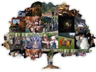
Kamp 2024 groepen 8

De leerlingen en leerkrachten keerden moe maar voldaan terug naar Zoetermeer. Het was een ongelooflijke ervaring waarbij de groepen 8 niet alleen hun grenzen hebben verkend, maar ook onvergetelijke herinneringen hebben gemaakt.